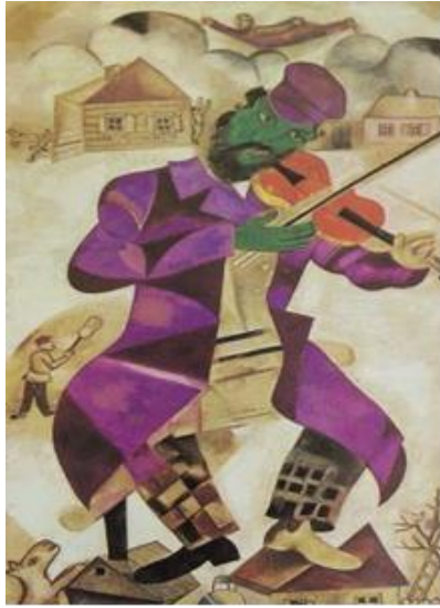
הכנר הירוק The Green Violinist 1924