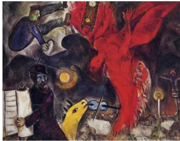
המלאך הנופל The Falling Angel 1947–1933–1922