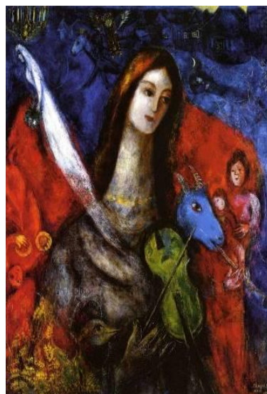
הקונצרט הכחול The Blue Concert 1945