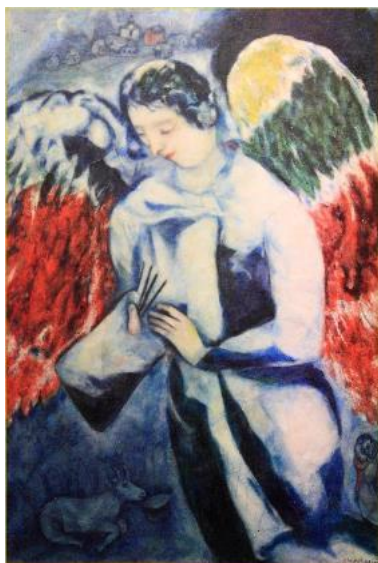
מלאך עם פלטה Angel with a Palette 1936–1927