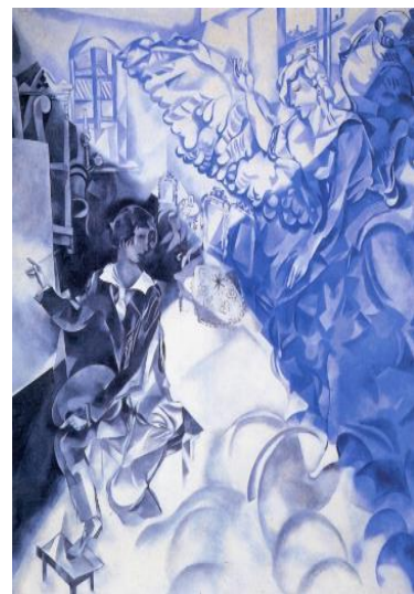
התגלות Apparition 1918-1917