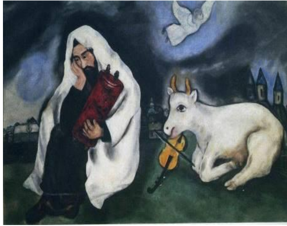
בידוד Solitude 1934–1933