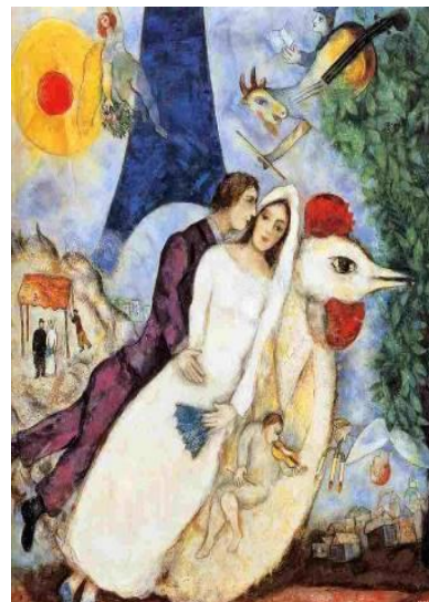
הזוג הנישא עם מגדל אייפל The Couple of the Eiffel Tower 1939–1938