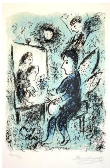
לקראת אור אחר Towards Another Light 1985