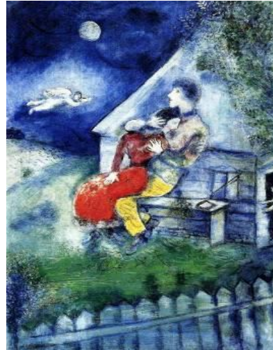
האוהבים The Lovers 1929