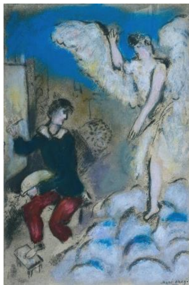
חזיון Vision 1925