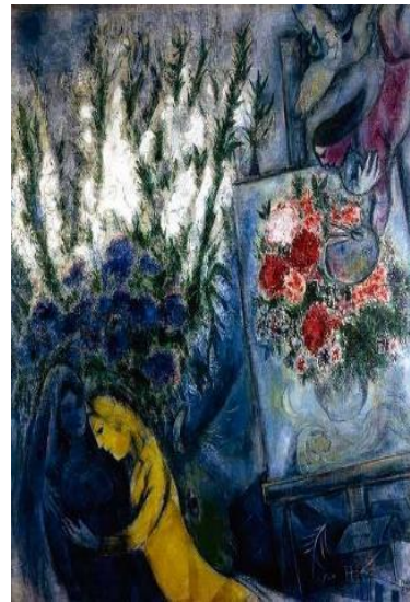
פרחי יום הנישואין Anniversary Flowers 1947