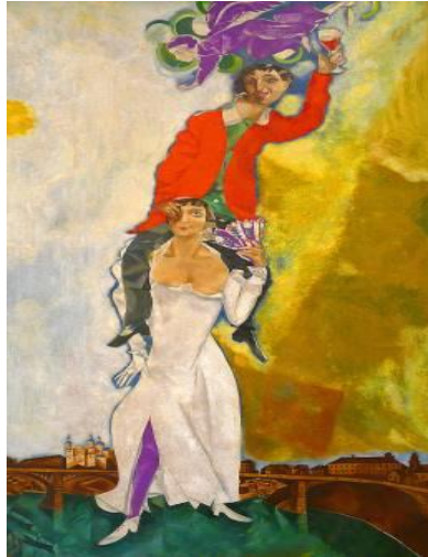
פורטרט כפול עם כוס יין Double Portrait with Wine 1918–1917